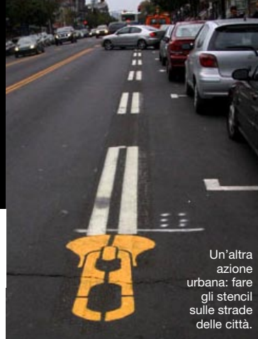
Un'altra azione urbana: fare gli stencil sulle strade delle città.