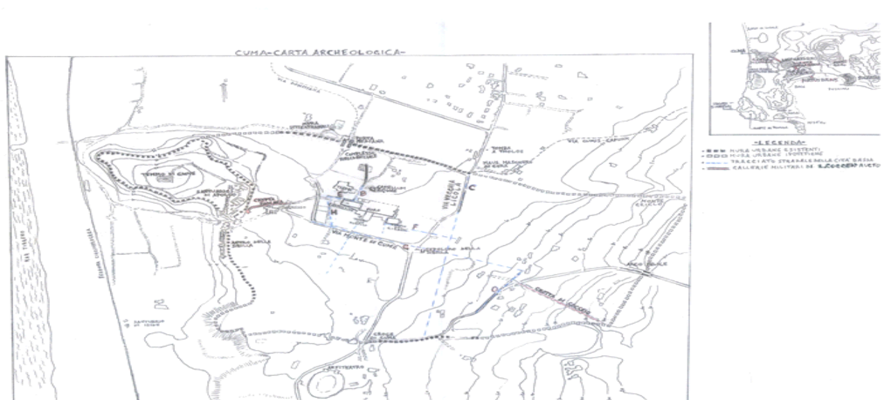
-Carta Archeologica di P. Caputo et Alii aggiornata al 2010 ( da mia Tesi )-

..... L' idea progettuale muove dall' approfondimento della Tesi in Archeologia Classica " Cuma: Topografia e Monumenti " del Corso di Laurea Triennale in "Cultura ed Amministrazione dei Beni Culturali", in quanto prossimo argomento di Tesi in Economia e Gestione dei Processi Culturali ed Ambientali " Neapolis-Cuma: la valorizzazione della viabilità antica " del Corso di Laurea Magistrale in "Organizzazione e Gestione del Patrimonio Culturale ed Ambientale".