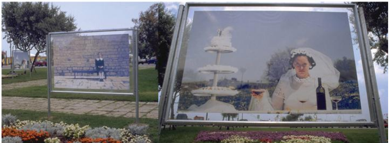
Elisa Laraia Aldina Giulia Gradisca 2000 Stampa plotter su back light, 85x125 m Aiuola riproduzione in prospettiva dell'immagine) Visione dell'installazione, intervento di Public art